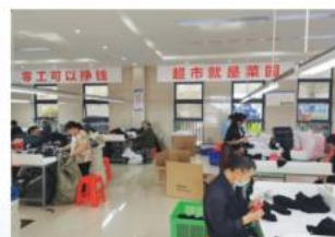
零工超市家门口挣钱