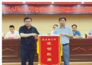
颁发支部流动红旗