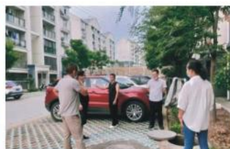
群众参与维修污水管道