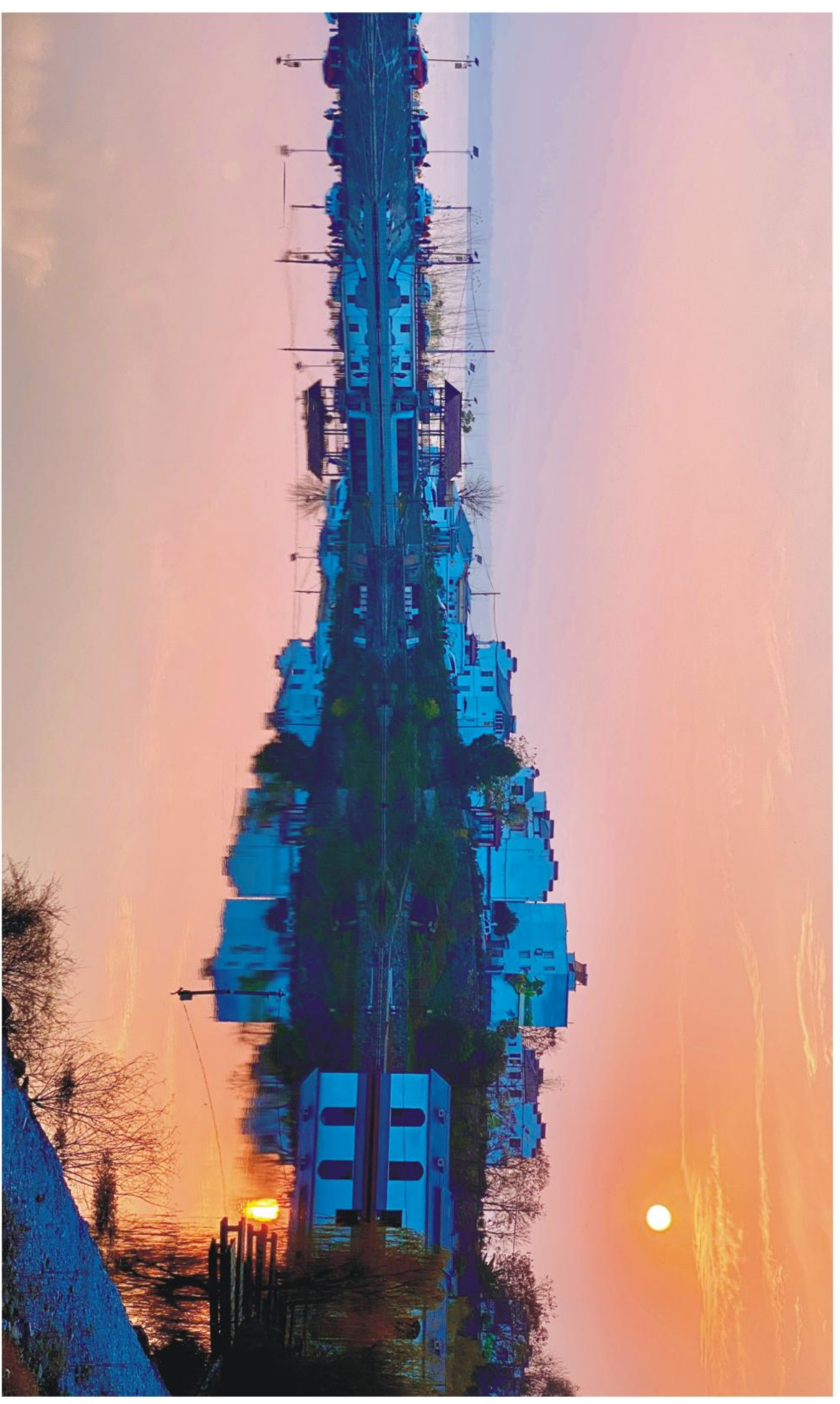
渔村夕照