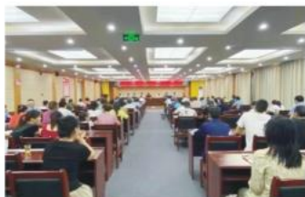
群众参与谋划社区发展

青龙泉社区聚焦基层组织建设、产业发展、环境改善和社区治理，健全纵向到底、横向到边的组织体系和以群众需求为导向的服务体系，开办“零工超市”解决弱劳力就业问题，自主组建物业公司和绿化公司，开展多层次评比，评选创业达人、贤惠人家、织袜能手、党员先锋、厚道邻居、平安卫士、香菇大王等模范代表，树立“感恩、自强、勤劳、互助”风尚。激发群众内生动力，充分依靠群众、发动群众、引导群众、组织群众，把群众变成社区建设主力，广泛开展美好环境与幸福生活共同缔造活动，把社区建成美丽幸福家园，走出了一条推动易迁社区后续高质量发展的路子。