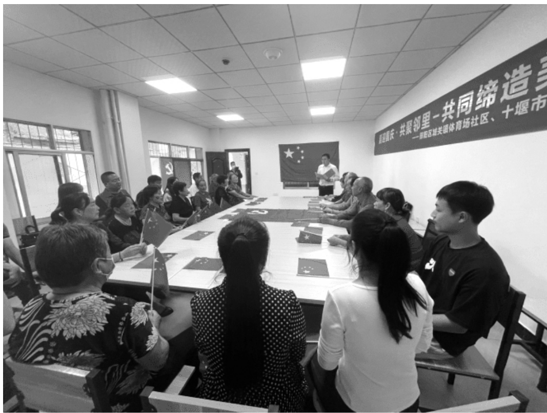
体育场社区群众共谋社区发展

(二)抓好整改提高。 将考评情况、存在的主要问题和不足,实事求是地向各试点村(社区)反馈,传导压力、激发动力,及时整改。