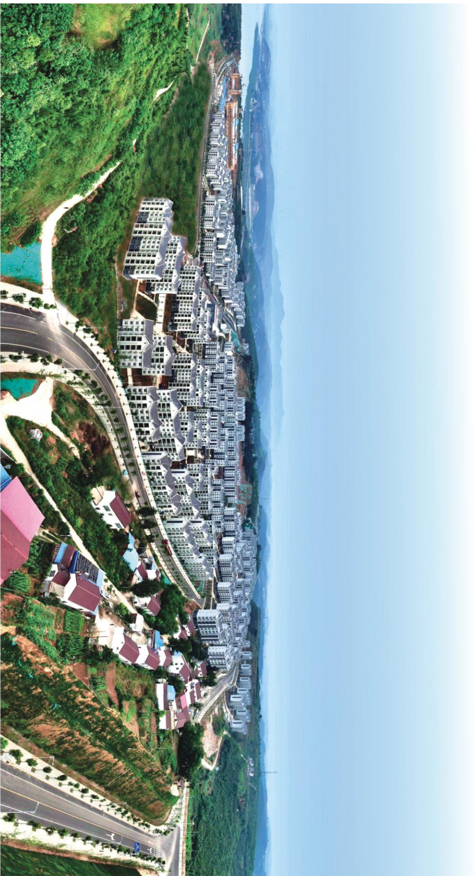
青龙泉社区全貌