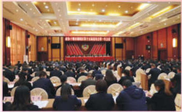
政协郟阳区第十五届委员会第一会议