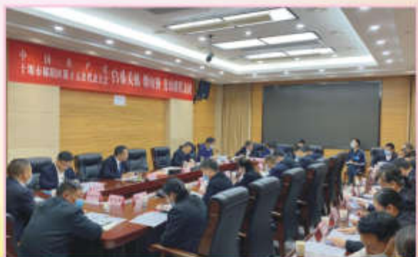
代表热议党代会报告