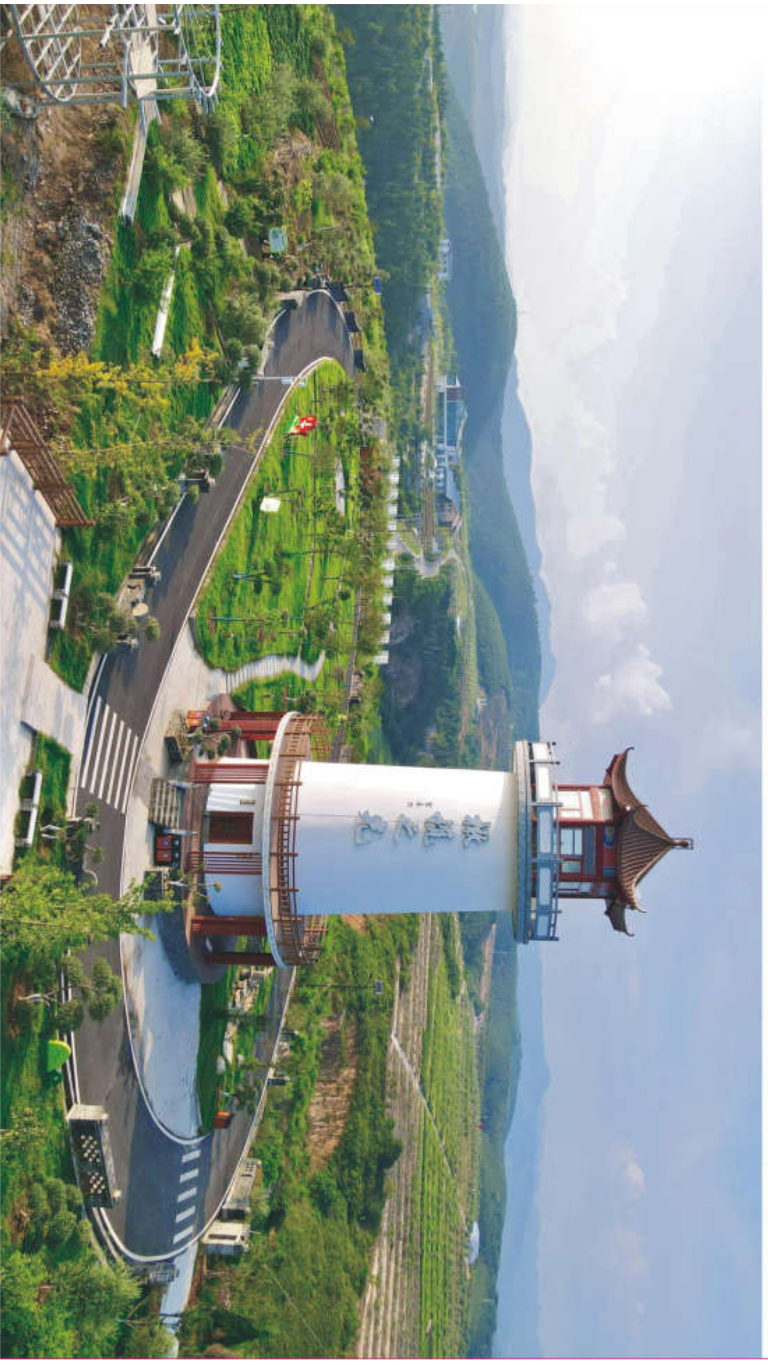
橄榄之光