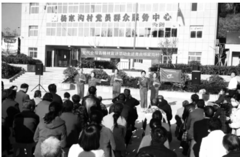
党代会报告精神宣讲活动走进青曲杨家沟村

大会号召，全区各级党组织和广大党员、干部群众，要紧密团结在以习近平同志为核心的党中央周围，在省委、市委的坚强领导下，解放思想，改革创新，践行“两山”理念，领跑绿色发展，实干善为，争作表率，为建设汉江新城、打造产业新区而努力奋斗！