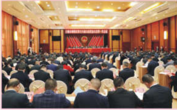
郟阳区第十八届人民代表大会第一次议