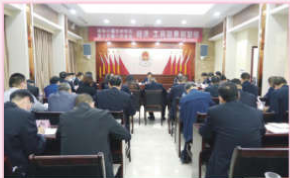
梅华参加经济 工商联界别代表团讨论