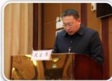
谭山镇党委书记 明东红