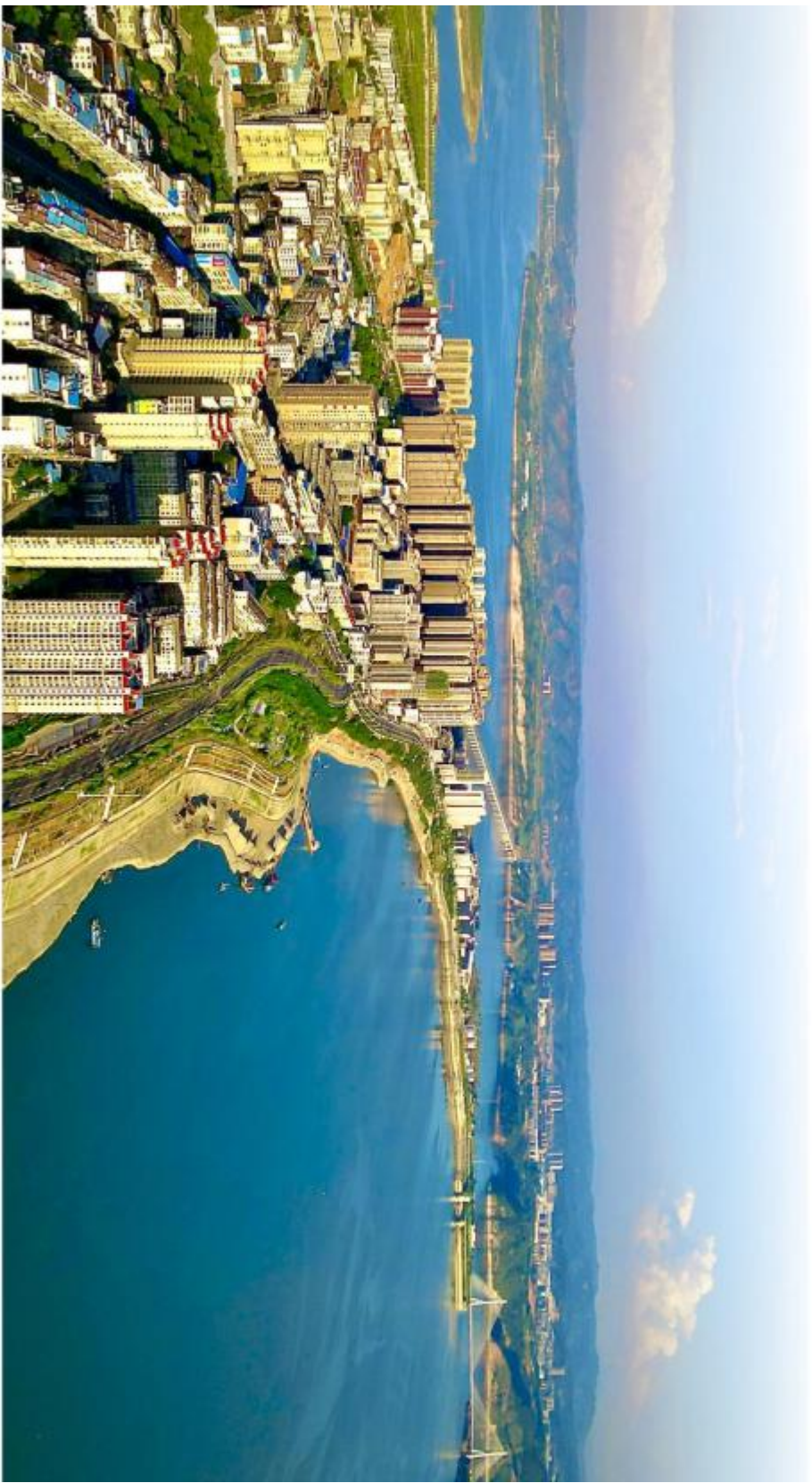
魅力邵阳